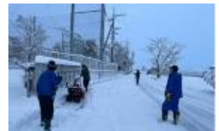
1時間半かけて校門へ 【小宮山区の皆様】