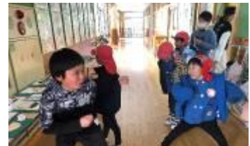
踊って緊張をほぐしてあげる

お家の人と離れられずに泣いてしまう子もいましたが、その子に駆け寄って安心できるように付き添ってくれた子、ペアの子が困らないように学校探検で手をつないで歩いてあげた子、「ここは音楽室だよ。」「ここは2年生より一つ大きい3年生の教室だよ。」とわかりやすく説明する子など、寄り添ってあげる姿に成長を感じるとともに泉っ子のよい伝統が引き継がれていることを感じました。