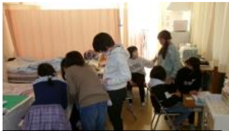
保健室で話し合いをしているところ

本校の課題の一つに、友だちの失敗に対し励ますのではなく、共感できずにばかりにすることから、互いにイライラし、トラブルやケンカが起きてしまうことがあります。そのケンカに対して、変な仲間意識が働き、仲裁をするのではなく味方をして人間関係をこじらせてしまうことが多く見られました。そこで、休み時間のドッジボールで起きたトラブルを、公平に話し合い、自分たちで解決した4年女児の取り組みを紹介しながら、仲直りの仕方を全校で確かめ、自分はどうしていくかを考えました。