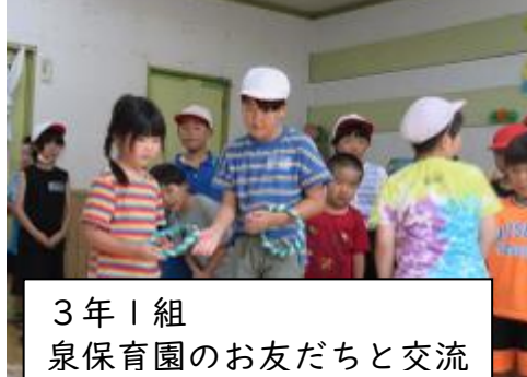
3年1組 泉保育園のお友だちと交流