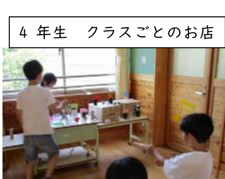
4年生 クラスごとのお店