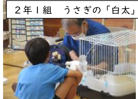
2年1組 うさぎの「白太」