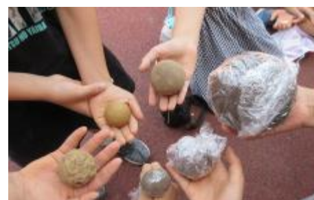
5年1組 「どろ団子」作り