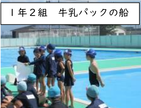
1年2組 牛乳パックの船