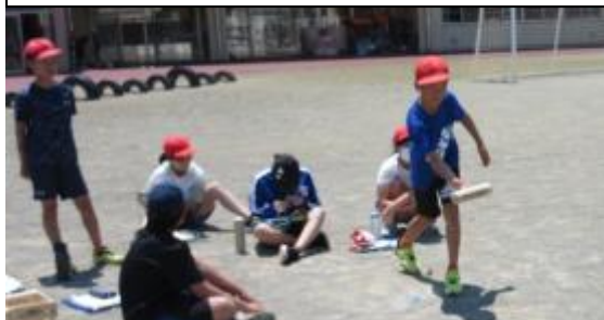
「モルック」(校庭) / 「ピロポロ」(体育館)