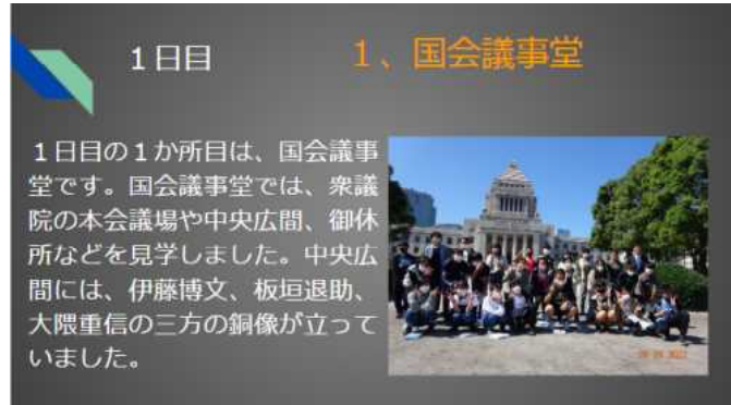
修学旅行の学習をまとめたスライド

3学期は登校日数が、46日と短いですが、これまでの学習のまとめをしたり、次の学年に進級・進学するための心の準備をしたりする時期となります。できた・分かったと自信をもって言えることが一つでも増えるように、3学期の目標、そして今年の目標を決め、目標に向かって頑張れる年になることを期待しています。