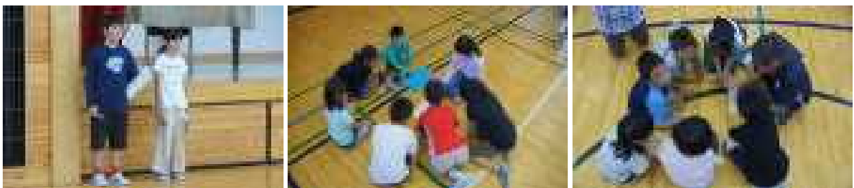
1～6年がみんなで協力する「たてわり清掃」が始まります。14日（木）の顔合わせの様子です。