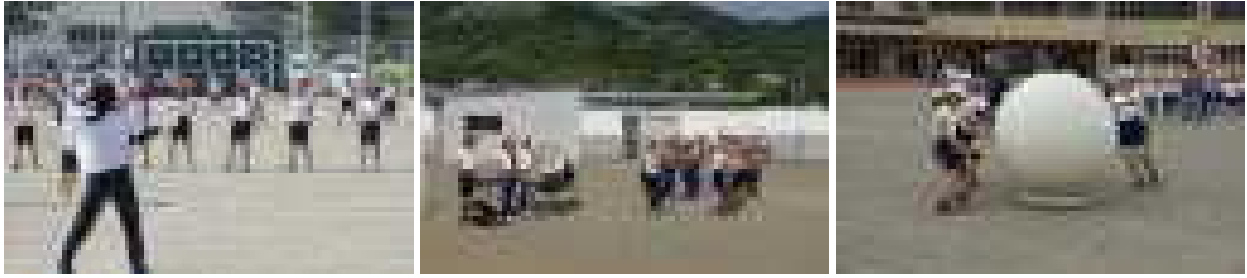
上下とも、運動会練習の様子です。特別時間割の2週間、毎日の練習をがんばりました。