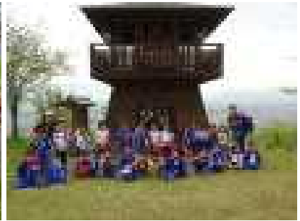
5月2日の春の遠足：1年生は虚空蔵山へ行ってきました