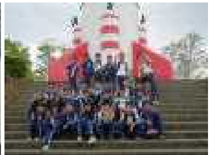
2年生はコスモタワーへ 帰りには一人ひとりバスの料金を払いました