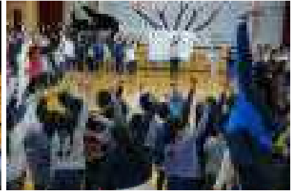
体をほぐして全校音楽