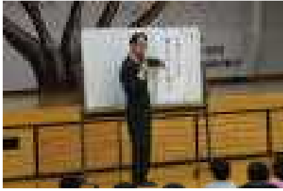
校長先生からなぜ「泉小」という校名になったのか教わりました