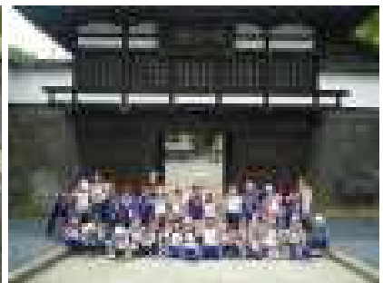
3年生は小海線で懐古園へ行きました 遊園地・動物園を楽しみました