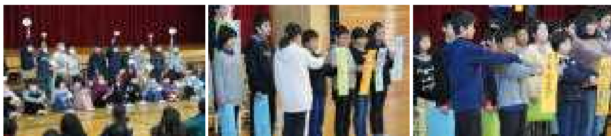
2学期の終業式では、2年生と6年生が学校生活を振り返る発表をしてくれました