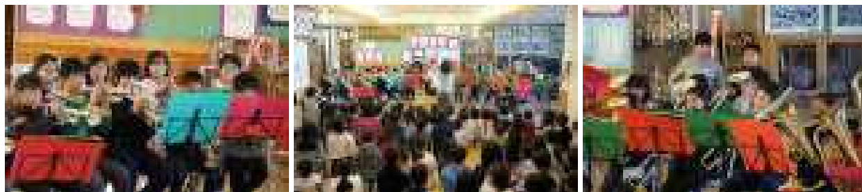
12月22日に金管クラブのクリスマスコンサートがありました 6年生はこれで引退です