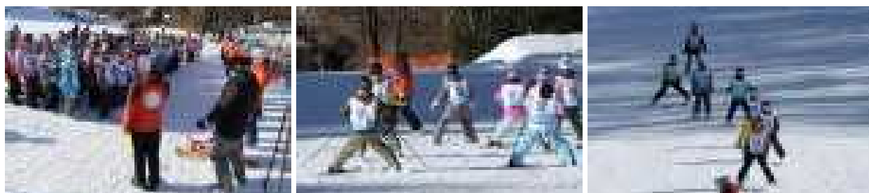
同じ日のパラダで、4～6年生はスキー教室を行いました