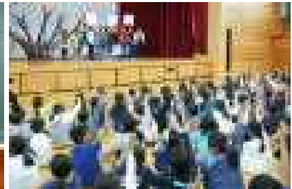
9/5 前期最後の児童会委員会がありました クイズで楽しんだ児童集会