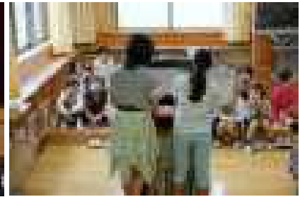
8/25 東京コールアカデミーによる、音楽鑑賞教室 休み時間の図書委員による紙芝居