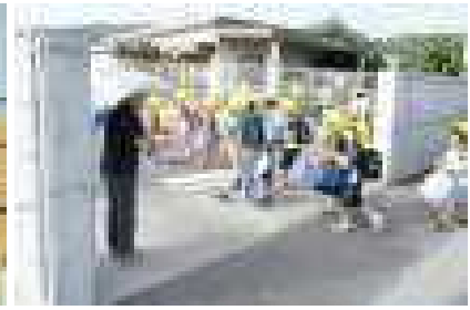
2学期始業式：各学年の代表の発表や転入生の紹介がありました 更生保護女性会あいさつ運動