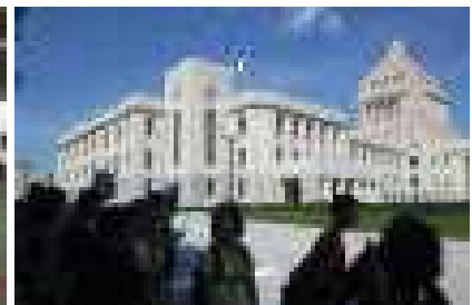
土曜参観日の校長講話の様子 9/13・14 6年が一泊二日で東京修学旅行へ

学校からのお願い 8/26のPTA資源回収へのご協力ありがとうございました。日常的にも、アルミ缶・段ボール等は、体育館南側の回収ステーションにて集めさせていただいています。引き続きご協力いただけますようお願いいたします。