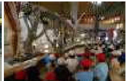
9/6 地震を想定した避難訓練と放課後には集団下校訓練 9/14 5年群馬社会見学