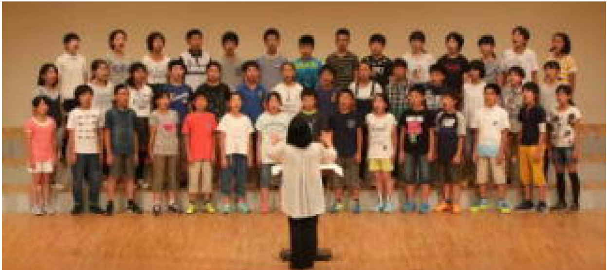
6年が参加した6月28日の市合同音楽会の様子です。(これだけ6月の報告ですが…)