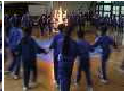
7月4・5日に5年がキャンプに行きました。雨の影響で雨天時案での実施となりました。