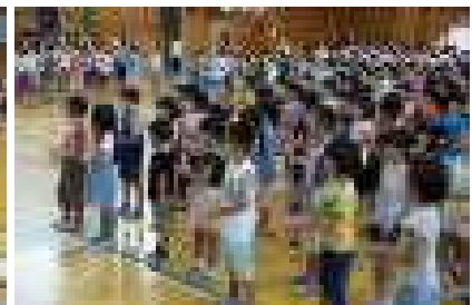
夏休みのプール開放にあわせ、救急法講習会が行われました。