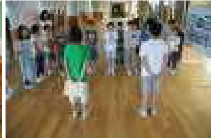
9/26に後期の児童会がスタートしました 左から図書・清美ボランティア・代表です