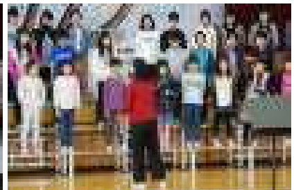
そして10月に入り、今、泉小は音楽会特別時間割の真っ最中です(当日の様子は次号で…)