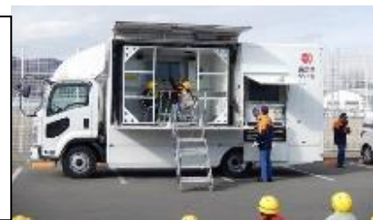
地震体験車(低学年児童が体験しました)