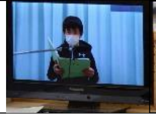
挨拶をする児童会長

6年生が中心となって児童会活動が行われてきました。そのまとめとして、テレビ放送による児童総会が2月9日に行われました。マイクの前に立ち、落ち着いた口調で発表する姿に6年生の成長が見られました。With コロナの中でしたが、各委員会で工夫をして活動に取り組んできました。委員会の活動を通して、スローガンの実現目指してがんばりました。来年度の児童会役員選挙もテレビ放送による立会演説会、分散投票が行われ、5年生への引継ぎが進んでいます。