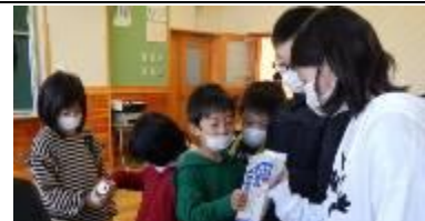
異年齢の縦割りグループで取り組んだ児童会祭り「分別クイズ」

泉小学校の皆さんが、お友達のことをもっともっと考えて、お友達に寄り添った行動が自然にできるようになるといいなと思います。頑張りましょう。